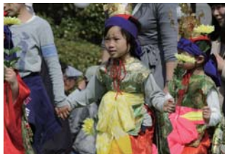
きらびやかな衣装を身にまとったお稚児さん達(衣装は貸出致します)