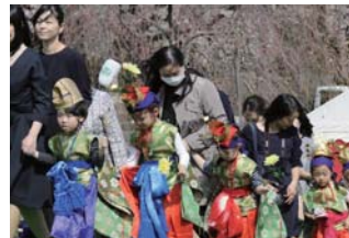
手を繋いで練り歩きます

日時 令和5年4月6日(木) お練り行列 13:30 / 大法要 14:00 ※雨天時には屋内にてお練り行列を行います。