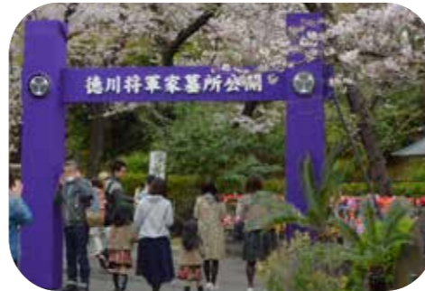
増上寺は、浄土宗の七大本山の一つです。徳川家6人の将軍とゆかりの方々が埋葬されています。