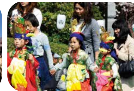
可愛いお稚児さんも行列に参列します。お稚児さんも募集しておりますので、お問合せください。