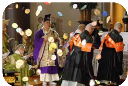
御忌日中法要では華を撒いて諸仏を供養する散華が見られます。