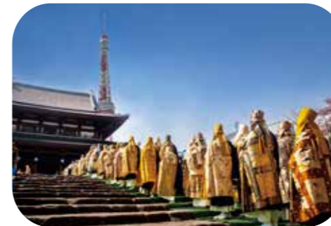
唱導師を中心としてお練行列を行い、古式ゆかしく大門から三門、大殿へと進みます。